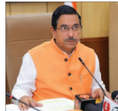
ಅವಾಚ್ಛ ಶಬ್ದಗಳಿಂದ ನಿಂದನೆ ಮಾಡಿ ಅವರು ಅಲ್ಲೇ ಸಿಕ್ಕರೂ ಅವರಿಗೆ ಕಲ್ಲಿನಿಂದ, ಬಾರಿಗೆಯಿಂದ ಮತ್ತು ಚಪ್ಪಲಿಯಿಂದ ಹೊಡೆಯುತ್ತೇವೆ ಎಂದು