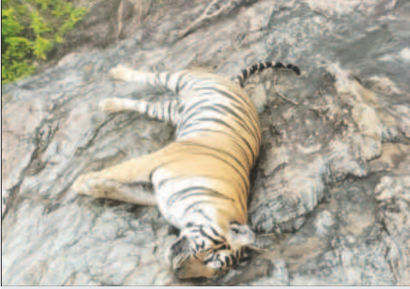
ಮೀಣ್ಯಂ ಸಮೀಪ ಟೈಗರ್ ಫ್ಯಾಮಿಲಿ ಡೆತ್