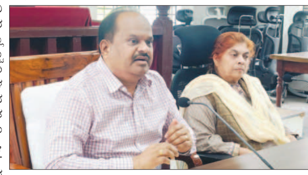
ಮುಖ್ಯವಾಗಿರುತ್ತದೆ. ಆದ್ದರಿಂದ ಕೆ.ಸಿ ವ್ಯಾಲಿ ನೀರು ಮತ್ತು ಮಳೆ ನೀರಿನ ಮೂಲಕ ಕೆರೆಗಳನ್ನು ಶುಚಿ ನಂತರ ಕೆರೆಗಳನ್ನು