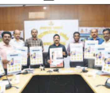
ಮತ್ತು ರುಬೆಲ್ಲಾ) ಲಸಿಕೆಯು ದಡಾರ ಮತ್ತು ರುಬೆಲ್ಲಾ ಎರಡರಿಂದಲೂ ರಕ್ಷಿಸಲು ಉತ್ತಮ ಮಾರ್ಗವಾಗಿದೆ. ಆದುದರಿಂದ ಸಾರ್ವತ್ರಿಕ ಲಸಿಕಾ ಕಾರ್ಯಕ್ರಮದಡಿಯಲ್ಲಿ ಗರ್ಭಿಣಿ ಸ್ತ್ರೀಯು ಗರ್ಭಧಾರಣೆಯ ಹಂತದಲ್ಲಿ ಟಿ.ಡಿ-1 ಟಿ.ಡಿ-2 ಲಸಿಕೆಯನ್ನು ಪಡೆಯಬೇಕು. ಮಗು ಹುಟ್ಟಿದ ನಂತರ ಹೆಚ್ಚೆಟ್ ಬಿ-24 ಗಂಟೆಯೊಳಗೆ ಲಸಿಕೆ ಹಾಕಿಸಬೇಕು. 6 ವಾರದೊಳಗೆ ಓ.ಪಿ.ವಿ -1, ರೋಟಾ -1, ಐಪಿವಿ-1, ಪಿಪಿವಿ-1 ಪೆಂಟಾವಲೆಂಟ್ -1, 10 ವಾರದೊಳಗೆ ಓ.ಪಿ.ವಿ -2, ರೋಟಾ -2, ಪೆಂಟಾವಲೆಂಟ್ -2 ಲಸಿಕೆ ಹಾಕಿಸಬೇಕು. 14 ವಾರದೊಳಗೆ ಓ.ಪಿ.ವಿ -3, ರೋಟಾ -3, ಪಿಪಿವಿ-2, ಪಿಪಿವಿ-2 ಪೆಂಟಾವಲೆಂಟ್ -3 ಲಸಿಕೆಗಳು, 9 ರಿಂದ 11 ತಿಂಗಳೊಳಗೆ ದಡಾರ-ರುಬೆಲ್ಲಾ -1, ಪಿ.ಪಿ.ವಿ ವರ್ಧಕ, ಜಿ-1, ಐಪಿವಿ - 3, ಹಾಗೂ 16 ರಿಂದ 23 ತಿಂಗಳೊಳಗೆ ದಡಾರ-ರುಬೆಲ್ಲಾ -2, ಓ.ಪಿ.ವಿ ವರ್ಧಕ, ಜಿ-2, ಡಿಪಿಟಿ ವರ್ಧಕ ಲಸಿಕೆಗಳನ್ನು ಹಾಕಿಸಬೇಕು ಈ ಕುರಿತು ಆರೋಗ್ಯ ಇಲಾಖೆಯ ಮಾರ್ಗಸೂಚಿಯನ್ನು ಸಾರ್ವಜನಿಕರು ಅನುಸರಿಸಲು ಕೋರಿದರು.

ಚಿಕ್ಕಬಳ್ಳಾಪುರ: ದಡಾರ-ರುಬೆಲ್ಲಾ ಕಾಯಿಲೆಯನ್ನು 2026 ನೇ ವರ್ಷದ ಒಳಗೆ ಮುಕ್ತ ಮಾಡಲು ಸಾರ್ವತ್ರಿಕ ಲಸಿಕಾ ಕಾರ್ಯಕ್ರಮದಡಿ 5 ವರ್ಷದೊಳಗಿನ ಎಲ್ಲಾ ಮಕ್ಕಳಿಗೆ ತತ್ಪರಿವೆ ಲಸಿಕಾಕರಣವನ್ನು ಸರ್ಕಾರ ಹಮ್ಮಿಕೊಂಡಿದ್ದು ಸಾರ್ವಜನಿಕರು ಇದರ ಸದುಪಯೋಗವನ್ನು ಪಡೆಯಬೇಕೆಂದು ತಮ್ಮ ಮಕ್ಕಳಿಗೆ ಲಸಿಕೆಯನ್ನು ಹಾಕಿಸಬೇಕೆಂದು ಜಿಲ್ಲಾಧಿಕಾರಿ ಪಿ.ಎನ್ ರವೀಂದ್ರ ಅವರು ಮನವಿ ಮಾಡಿದರು.