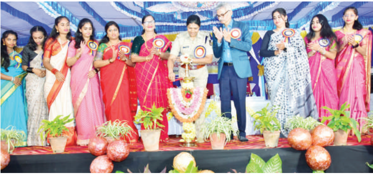
ಬಗ್ಗೆ ತಿಳಿಸುತ್ತಾ ವಿದ್ಯಾರ್ಥಿಗಳನ್ನು ಜಾಗೃತಗೊಳಿಸಿದರು.

ಅವರು ವಿದ್ಯಾರ್ಥಿನಿಯರನ್ನು ಉದ್ದೇಶಿಸಿ ಮಾತನಾಡಿ, ಶೈಕ್ಷಣಿಕ ಪ್ರಗತಿಯೊಂದಿಗೆ ಆರ್ಥಿಕ ಬೆಳವಣಿಗೆಯೂ ಕೂಡ ಮುಖ್ಯ. ವಿದ್ಯೆಯೊಂದಿಗೆ ಮಾನವೀಯ ಮೌಲ್ಯಗಳು ಕೂಡ ಅತಿ ಮುಖ್ಯ. ಮಾನವೀಯತೆಯಲ್ಲದ ವಿದ್ಯೆಯು ಮೌಢ್ಯಕ್ಕೆ ಸಮ. ಆತ್ಮಸಾಕ್ಷಾತ್ಕಾರವೇ ಶಿಕ್ಷಣ. ಒಂದು ಹೆಣ್ಣು ಕಲಿತರೆ ಶಾಲೆಯೇ ತೆರೆದಂತೆ ಎಂಬ ನಾಣ್ಯಾಡಿ ಕಲಿಕೆಯ ಮಹತ್ವವನ್ನು ತಿಳಿಸುತ್ತದೆ. ಕೇವಲ ವಿದ್ಯೆಯೊಂದಿಗಿದ್ದರೆ ಸಾಲದು, ವಿದ್ಯೆ ಜೊತೆಗೆ ಸರಳತೆ, ಪರೋಪಕಾರವು ಕೂಡ ಮುಖ್ಯ. ಅಸಗಳು ಕಡಿಮೆ ಆದರೆ ಲೋಭತೆ ಕಡಿಮೆ ಆಗುತ್ತೆ. ವಿದ್ಯೆಯ ಹಂಬಲಕ್ಕೆ ಮೊಬೈಲ್, ಟಿವಿ, ಮುದ್ದವುಗಳಿಂದ ದೂರವಿರುವುದು ಆಗುತ್ತೆ. ಪೋಷಕರ ನಂಬಿಕೆ ಉಳಿಸುವುದು ಪ್ರತಿಯೊಬ್ಬ ವಿದ್ಯಾರ್ಥಿಗಳ ಅದ್ಯ ಕರ್ತವ್ಯ. ಆಧುನಿಕರಣ, ನಗರೀಕರಣದಿಂದ ಆಗುವ ದುಷ್ಪರಿಣಾಮದ