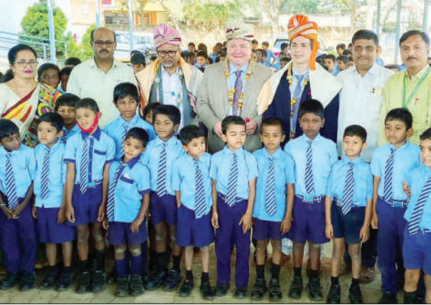
ವಿಜಯಪುರ ಪಟ್ಟಣದ ಜಿ.ಕೆ.ಬಿ.ಎಂ.ಎಸ್. ಶಾಲೆಗೆ ಭೇಟಿ ನೀಡಿದ್ದ ಇಂಡಿಯನ್ ಅಯುಲ್ ಸೈಟ್ರಾಂಕಿಂಗ್ ಕಂಪನಿಯ ಮುಖ್ಯಸ್ಥರನ್ನ ಶಾಲಾಭಿವೃದ್ಧಿ ಸಮಿತಿಯ ವತಿಯಿಂದ ಅಭಿನಂದಿಸಿದರು.