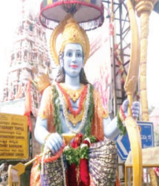
ಕ್ರಣಕ್ಕಾಗಿ ಇಡೀ ಭಾರತವೇ ಕಾತುರದಿಂದ ಕಾಯುತ್ತಿದೆ. ಇನ್ನು ಸಿಲಿಕಾನ್ ಸಿಟಿಯ ಹೃದಯ

ಬೆಂಗಳೂರು: ಇಡೀ ದೇಶವೇ ರಾಮನ ಪ್ರಾಣಪ್ರತಿಷ್ಠೆ ಕಾರ್ಯಕ್ರಮಕ್ಕಾಗಿ ಕಾದು ಕುಳಿತಿದೆ. ರಾಮನಾಮದ ಜಪ ಕಲ್ಪ ಕಡೆ ಜೋರಾಗಿದೆ. ರಾಮ ಎಂಬ ಎರಡಕ್ಷರ ಹೊಸದೊಂದು ಅನುಭವ ನೀಡುತ್ತಿದೆ. ಅಯೋಧ್ಯೆಯಲ್ಲಿ ರಾಮಲಲ್ಲಾನ್ ಪ್ರಾಣಪ್ರತಿಷ್ಠೆಗೆ ಸಕಲ ಸಿದ್ಧತೆ ನಡೆಯುತ್ತಿದ್ದರೆ ಇತ್ತ ಬೆಂಗಳೂರಿನಲ್ಲಿ ಬೃಹತ್ ರಾಮನ ಮೂರ್ತಿ ಜನರನ್ನು ಆಕರ್ಷಿಸುತ್ತಿದೆ.