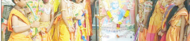
ವಿದ್ಯಾವಾಂಧಿ ಇಂಟರ್ ನ್ಯಾಷನಲ್ ಸ್ಕೂಲ್‌ನಲ್ಲಿ ಆಯೋಧ್ಯೆಯಲ್ಲಿ ಶ್ರೀರಾಮ ಮೂರ್ತಿ ಪ್ರತಿಷ್ಠಾಪನ ನಡೆಯುವ ಹಿನ್ನೆಲೆಯಲ್ಲಿ ಸಂಭ್ರಮಾಚರಣೆ ಮಾಡಲಾಯಿತು.