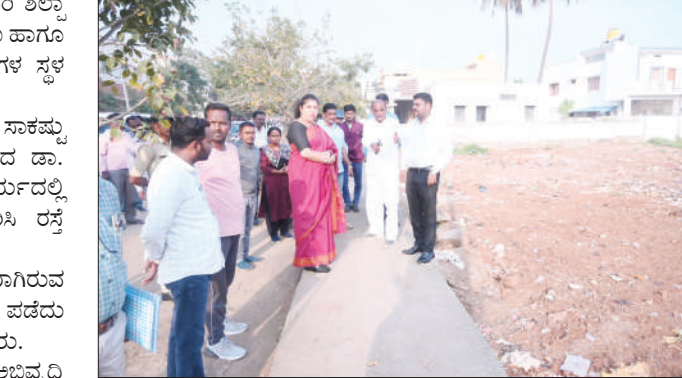
ಅಧಿಕಾರಿಗಳು ಯಾವುದೇ ಒತ್ತುಡಕ್ಕೂ ಒಳಗಾಗಬಾರದು. ರಸ್ತೆ ಆಗಲೀಕರಣದಿಂದ ಆಸ್ತಿ ಕಳೆದುಕೊಂಡಿರುವವರ ಪಟ್ಟಿ ಮಾಡಿ ಪರಿಹಾರ ವಿತರಣೆ ಕಾರ್ಯವನ್ನು ಅದ್ವೈತ ಮೇರೆಗೆ ಮಾಡಿಕೊಡಲಾಗುವುದು ಎಂದರು.